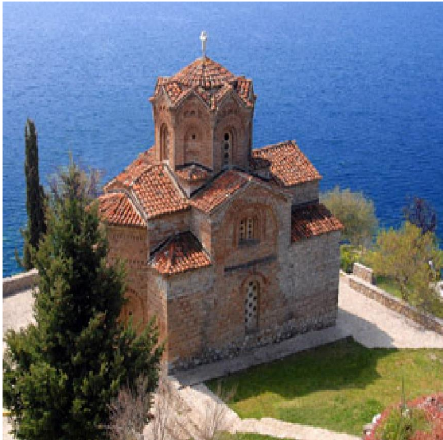
St John Kaneo - Ohrid, Macedonia, 13th century