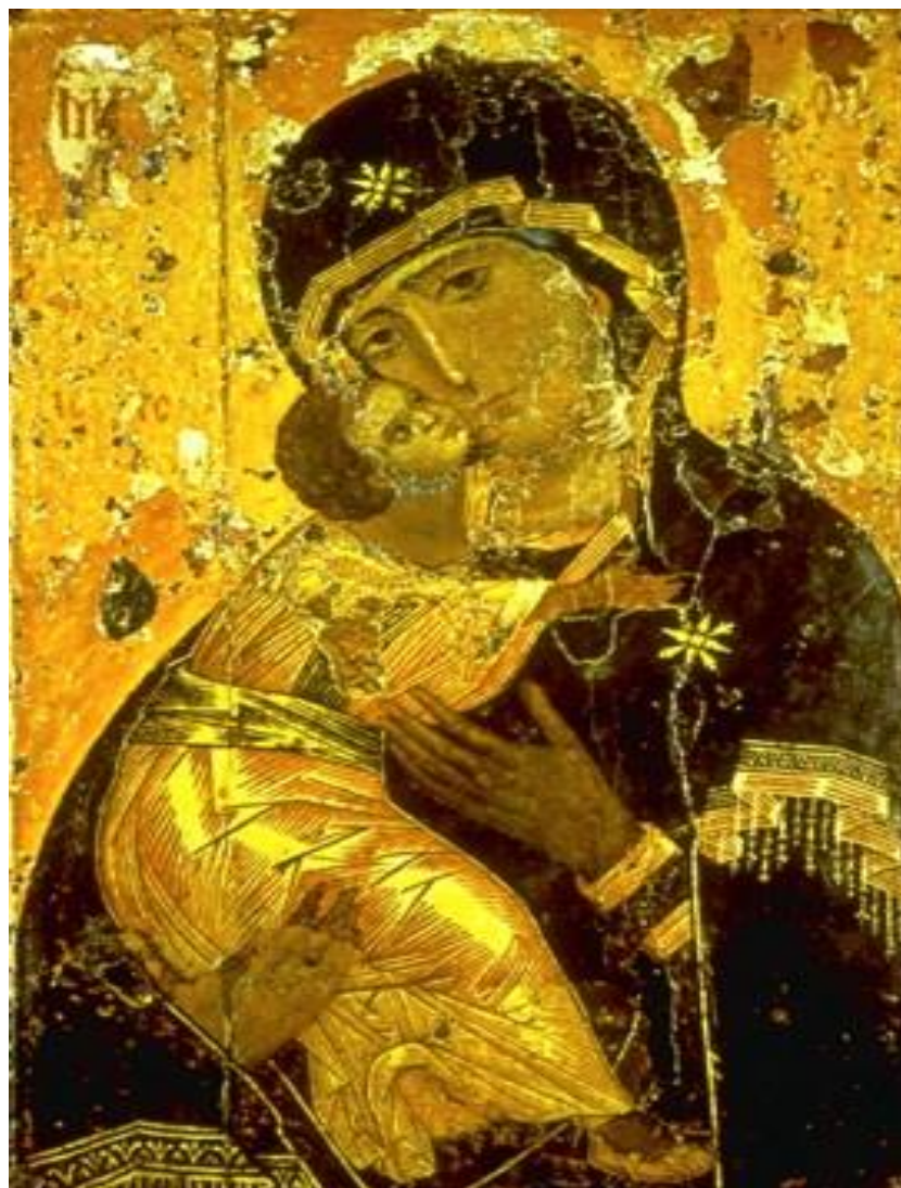
The Mother of God - 12th century